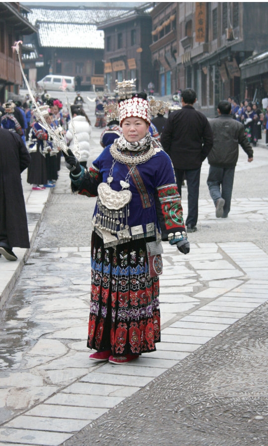
▲ 苗族妇女盛装迎春 ▼ 贵州黔东南苗族侗族自治州西江千户苗寨雪景

多公里，但我们当天往返却用了7个多小时。心急如焚的我们一下车就匆匆赶去采访，在返回路上顾不上吃饭、抱着电脑晃晃荡荡的赶稿子。