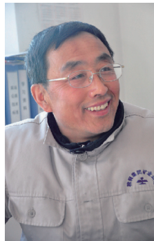
大爱无声 雷锋传人——郭明义20年无偿献血6万毫升