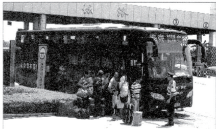
图为乘客在等候换乘。

随后,治超站队员告知粤AJ05xx司机,请他立即将车开到南宁高速公路坛洛治超站汇合点进行交接。